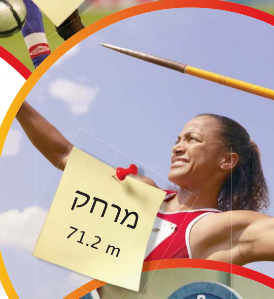
בייג'ין אצטדיון אולימפי